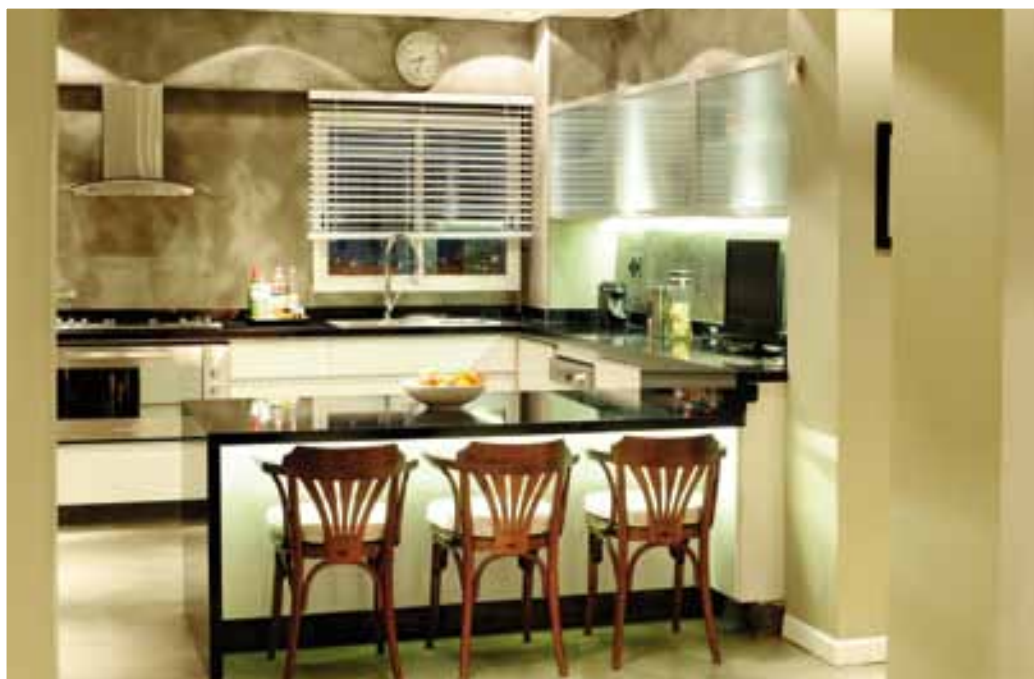
La cocina tiene pisos y paredes de concreto pulido, mesada de granito negro y gabinetes en blanco laqueados en semi-brillo. Tres butacas vienas acompañan la isla de la cocina.

Comedor y cocina están totalmente integrados. El comedor cuenta con una mesa de madera wenge, con sillas del mismo material tapizadas en hilo crudo, la consola del comedor está empotrada entre las dos paredes diseñadas para exponer los cuadros de Guerreros, y la misma cuenta con el mismo concepto de la consola del living -amurada a la pared pero que parece estar suspendida en el aire- laqueada en mate del