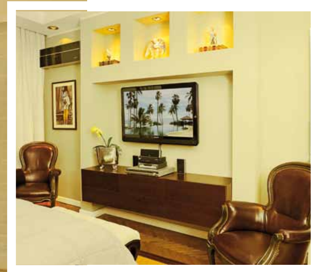
La cama con respaldo Fendi en madera cherry se complementa con las mini cómodas utilizadas como mesas de apoyo y una consola suspendida en esa pared diseñada para la misma, con nichos para exhibir mini esculturas pertenecientes a la colección personal del cliente.